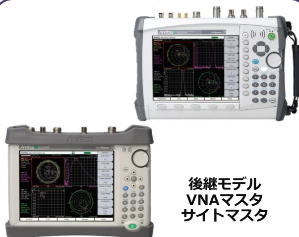
後継モデル VNAマスタ サイトマスタ