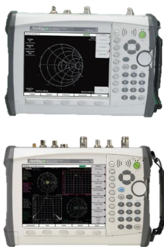
旧モデル VNA マスタ

お手持ちの弊社 旧モデルのVNA マスタの後継モデルをご案内いたします。 この機会に是非、最新モデルへの置き換えをご検討ください。