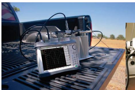
▲通信分野、屋外用途

主な用途は、パッシブ/アクティブデバイスやコンポーネントのSパラ測定、レーダー、無線基地局建設、防衛関連、車載通信システムなどの測定に利用できます。