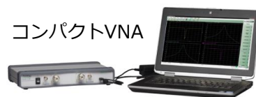
代替モデル コンパクトVNA